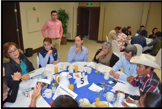
Figura 1.5 fotografía mesa igualdad