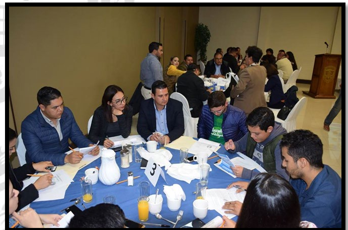
Figura 1.4 fotografía mesa juventud