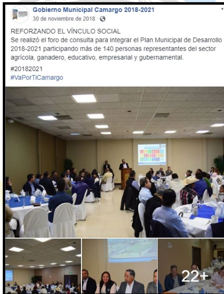
Figura 1.2 Publicación en la página de FaceBook del Ayuntamiento

https://www.facebook.com/search/top/?q=foro%20plan%20municipal&epa=SEARCH_BOX