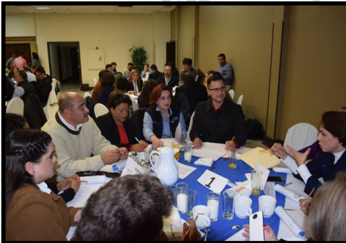
Figura 1.7 fotografía mesa Salud