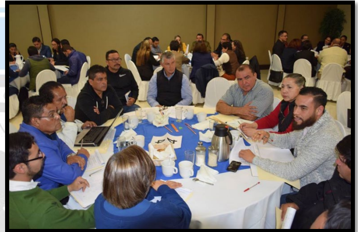
Figura 1.3 fotografía mesa recreación y deporte