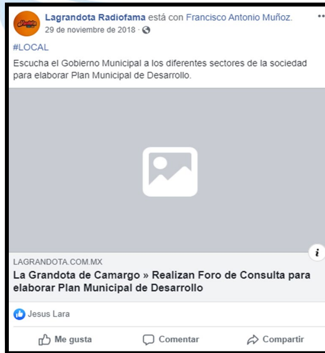
Figuras 1.11 Publicación en página La Grandota Invitación