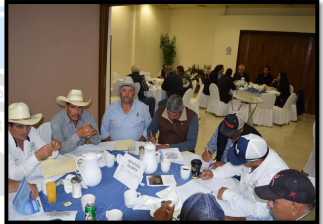
Figura 1.6 fotografía mesa Agricultura y ganadería