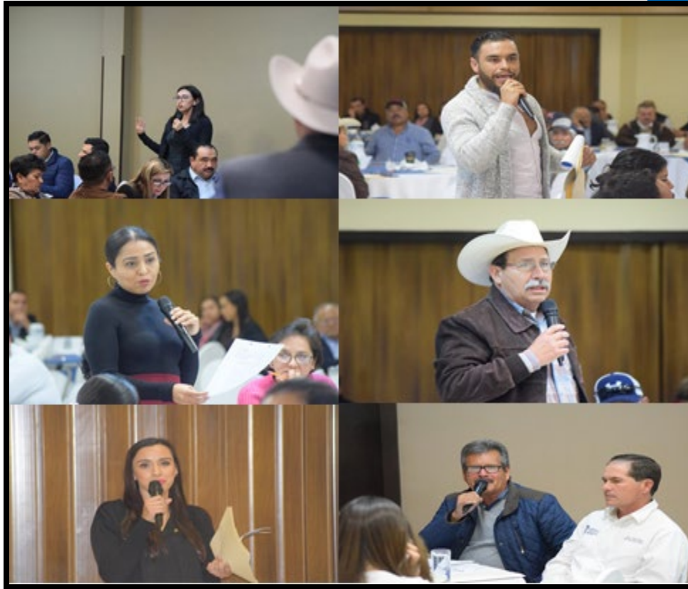
Figura 1.9 Intervenciones de participantes