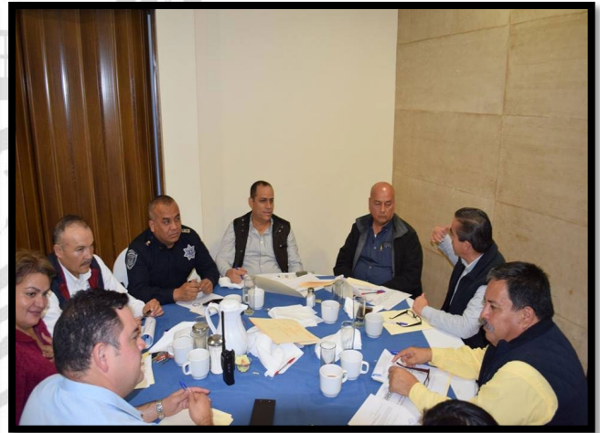
Figura 1.8 fotografía mesa Seguridad y estado de derecho

Foro de exposición y consulta para la elaboración del Plan Municipal de Desarrollo 2018-2021 alineado a la agenda 20-30.