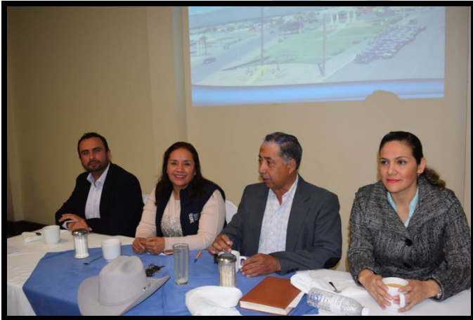
Figura 1.2 fotografía presidium