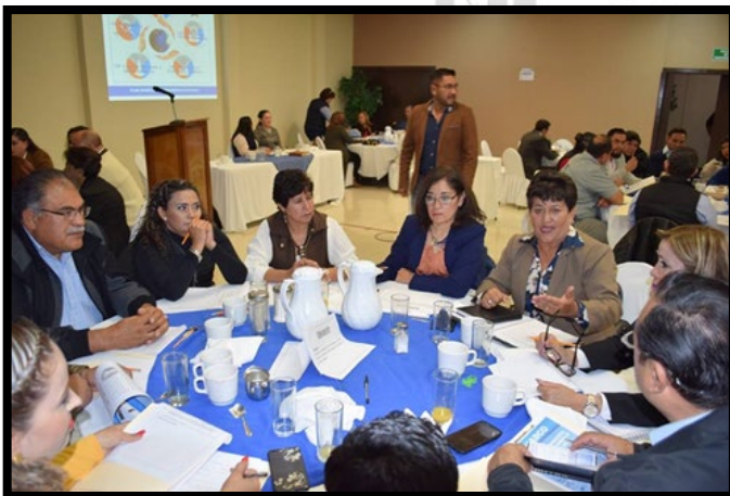
Figura 1.3 fotografía mesa educación